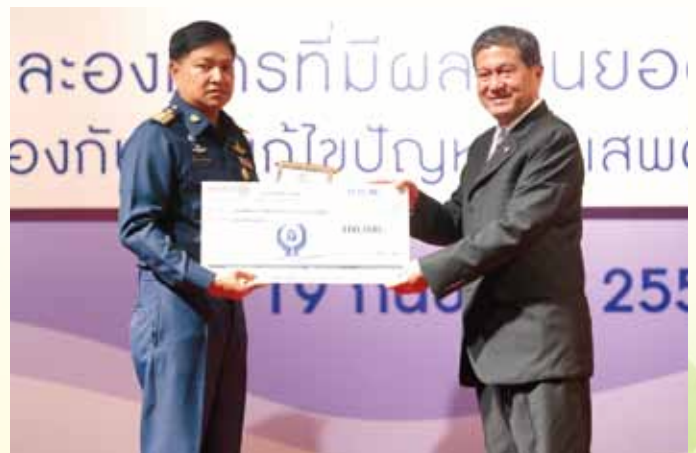
ระดับยอดเยี่ยม (ประเภทองค์กร) 5. ศูนย์ฟื้นฟูสมรรถภาพผู้ติดยาเสพติด กองบิน 46 จังหวัดพิษณุโลก