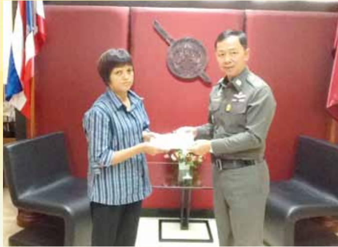
ทายาทของ พ.จ.อ.ยศศิริ นาววัฒน์