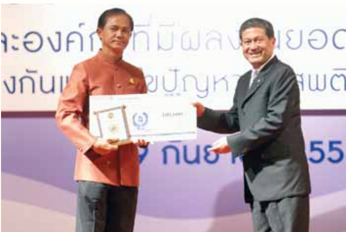
ระดับยอดเยี่ยม (ประเภทบุคคล) 2. นายชวน ตีรันทพร ผู้ว่าราชการจังหวัดนครราชสีมา