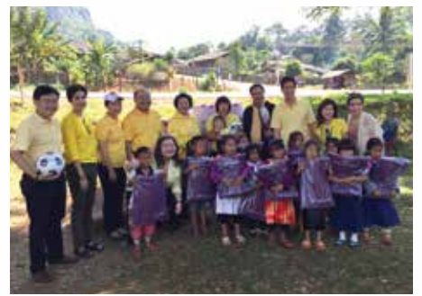
โรงเรียนบ้านรินทอง อ.เชียงดาว จ.เชียงใหม่

1. บริจาคผ้าห่มให้แก่ผู้ประสบภัยหนาว เด็กนักเรียน ประชาชน ทหาร และตำรวจตระเวนชายแดนในถิ่นทุรกันดาร อาทิ จ.แม่ฮ่องสอน เชียงราย เชียงใหม่ ลำปาง น่าน กาฬสินธุ์ จำนวน 20,600 ผืน เป็นจำนวนเงิน 1,789,040.-บาท