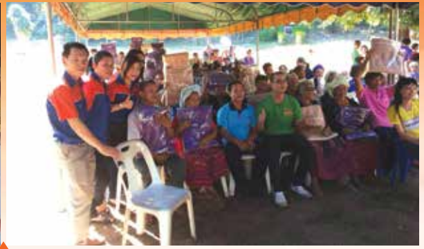
หมู่บ้าน อพป.บ้านห้วยแก้ว จ.แม่ฮ่องสอน