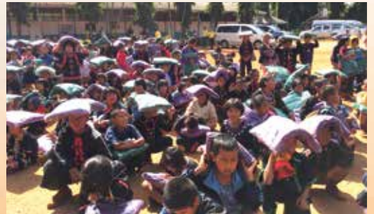
โรงเรียนบ้านหนองเขียว อ.เชียงดาว จ.เชียงใหม่