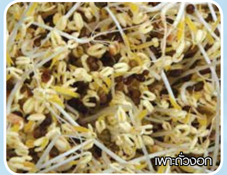
เพาะถั่วงอก