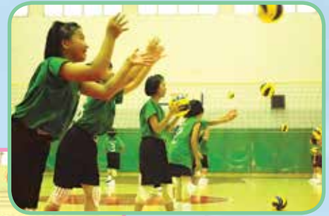
▲ อบรมวอลเลย์บอลหญิง ◀ อบรมบาสเกตบอลชาย