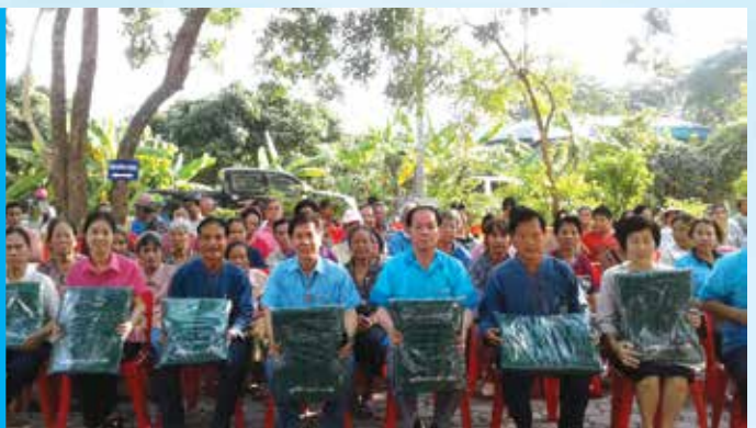
รพ.ส่งเสริมตำบลปากบ่อง และ เชมรมผู้สูงอายุ วัดพระพุทธบาทตากผ้า จ.ลำพูน