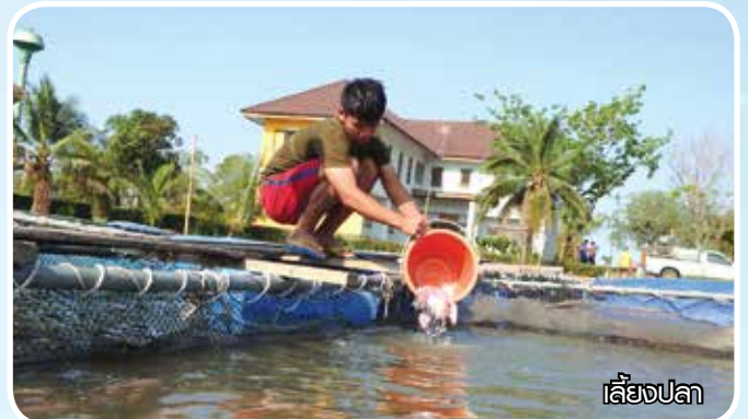
เลี้ยงปลา