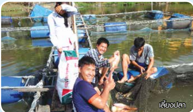
เลี้ยงปลา