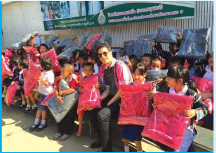
ร.ร.รอยยิ้มใจ (เขต.อนุสรณ์) จ.เชียงราย