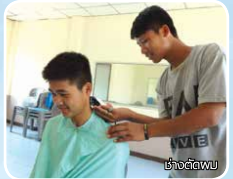
ช่างตัดผม