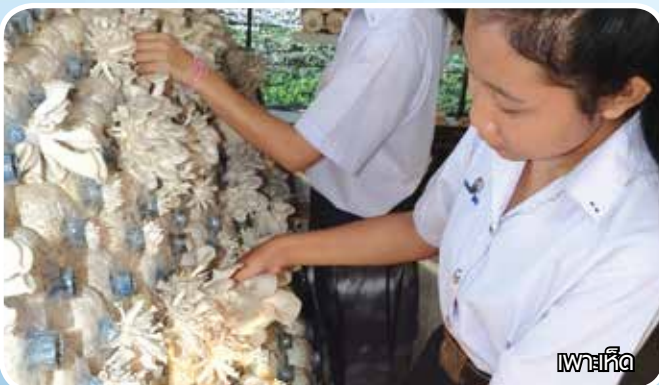
เพาะเห็ด