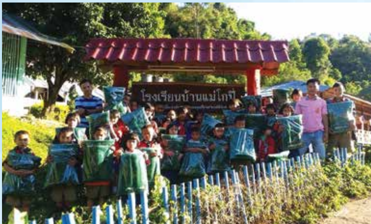
ร.ร.บ้านไก่ จ.แม่ฮ่องสอน