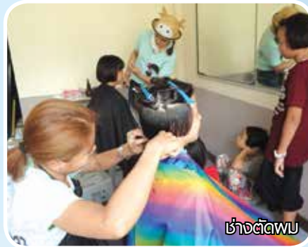
ช่างตัดผม