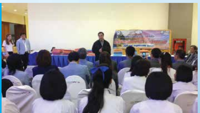
จ.อุดรธานี