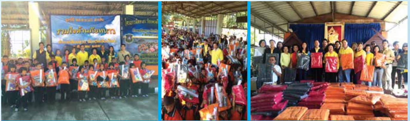
รร.บ้านวังจ้อม และ รร.บ้านดอน อ.เชียงดาว จ.เชียงใหม่