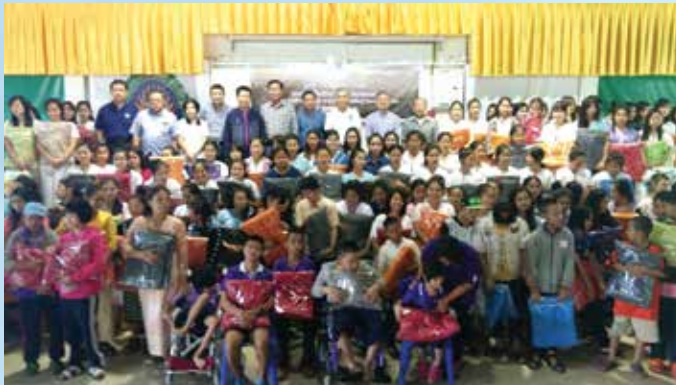
วิทยาลัยแม่ฮ่องสอน จ.แม่ฮ่องสอน

มูลนิธิฯ ได้ตระหนักถึงความสำคัญในการส่งเสริมและช่วยเหลือประชาชนในสังคมให้มีคุณภาพชีวิตที่ดีขึ้น ซึ่งในสังคมไทยยังมีประชาชนที่ขาดแคลนและด้อยโอกาสในถิ่นทุรกันดารอีกมากที่ประสบปัญหาความเดือดร้อน มูลนิธิฯ จึงได้สนับสนุนกิจกรรมที่เป็นประโยชน์ต่อสังคม อาทิ ผู้ประสบภัยหนาว เพื่อช่วยบรรเทาความเดือดร้อนในถิ่นทุรกันดาร