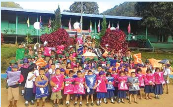
ร.ร.บ้านห้วยบุลึง จ.แม่ฮ่องสอน