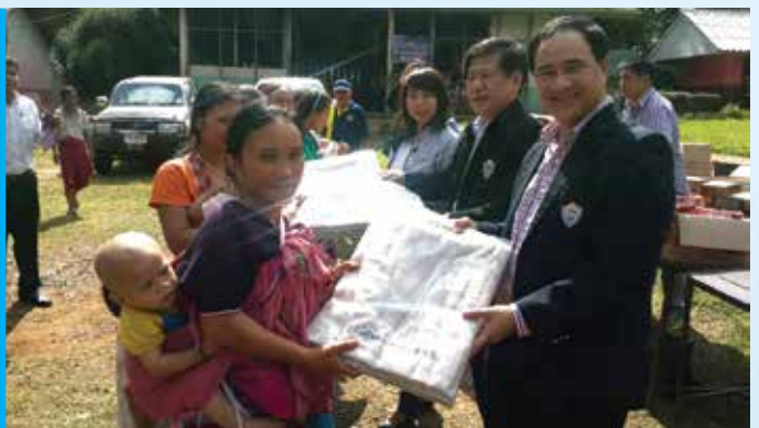
ร.ร.รวมไทยพัฒนา 4 จ.ตาก