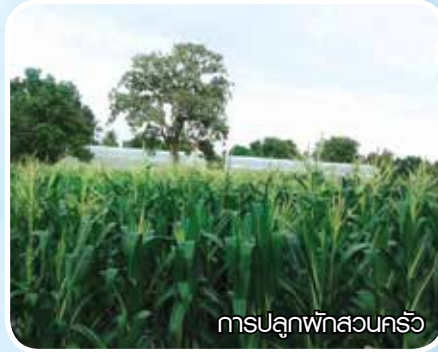
การปลูกผักสวนครัว