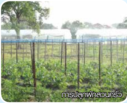
การปลูกผักสวนครัว

บ้านตะวันออกส่งเสริมให้ทำการเกษตรสำหรับประกอบอาหารรับประทานเองและเพื่อเป็นการเรียนรู้ทฤษฎีเศรษฐกิจพอเพียงเป็นแนวทางในการดำรงชีวิตในอนาคต เช่น ปลูกผักสวนครัว เพาะถั่วงอก เลี้ยงปลา ช่างตัดผม เพาะเห็ด ตะกร้าเดคูพาจ (โดยการนำกระดาษลายต่างๆ มาติดบนตะกร้าสานพลาสติก) พร้อมทั้งได้ประสานงานกับกลุ่มบุคคล องค์กรต่างๆ ที่จะเข้ามาจัดกิจกรรมให้เน้นกิจกรรมที่สามารถนำไปประกอบอาชีพได้ อาทิ การจัดดอกไม้ ทำขนม ศิลปะจากกระดาษ