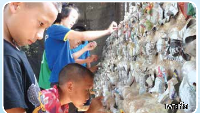
เพาะเห็ด