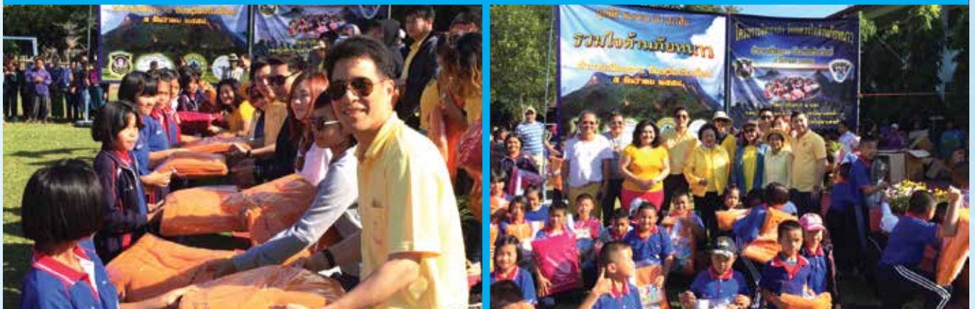
รร.บ้านนาหวาย อ.เชียงดาว จ.เชียงใหม่