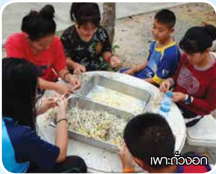
เพาะถั่วงอก