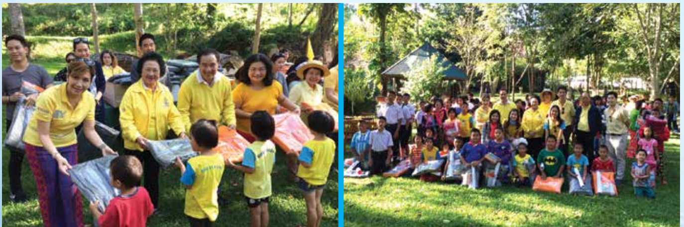
อุทยานแห่งชาติน้ำพุโป่งอาง อ.เชียงดาว จ.เชียงใหม่